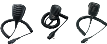
HM-168LWP HM-158LA HM-159LA

HM-159LA: Lautsprecher-Mikrofon mit 3,5-mm-Stecker