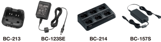
BC-213 BC-123SE BC-214 BC-157S

* Der Ladeadapter AD-130 wird mit dem BC-214 geliefert, je nach Version.